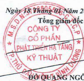
ĐỖ QUANG NGÔN