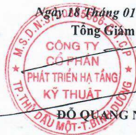
ĐỖ QUANG NGÔN